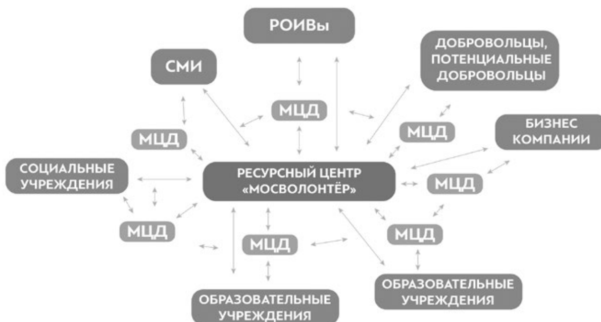
Рис. 3. Территориальная модель инфраструктуры добровольчества на региональном уровне (на примере Москвы)