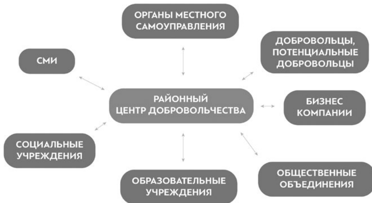
Рис. 2. Территориальная модель инфраструктуры добровольчества на местном (районном) уровне.